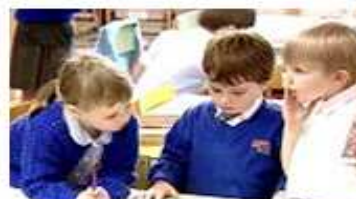
2 nd grade pupils

They have to do a project on history and they need a place to work together.